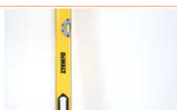
Niveau à bulle (vertical)