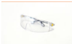
Lunettes de sécurité