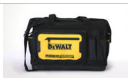
Sac à outils