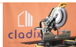
Scie à onglet (ou scie à main et/ou scie à métaux ordinaire)