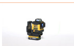
Laser à lignes croisées