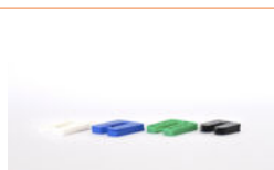
Blocs de réglage en plastique de différentes épaisseurs

! SUIVEZ TOUJOURS LES CONSIGNES ET LES PROCÉDURES DU FABRICANT OU DU FOURNISSEUR. VEILLEZ TOUJOURS À AVOIR UN ENVIRONNEMENT DE TRAVAIL SÛR ET UTILISEZ TOUJOURS DES ÉQUIPEMENTS DE PROTECTION INDIVIDUELLE.