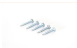
Vis autotaraudeuses (+ embouts assortis)