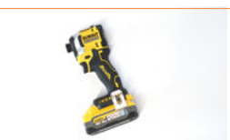
Visseuse ordinaire ou perceuse à percussion