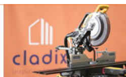
Afkort- en verstekzaag (of gewone hand- en/of metaalzaag)