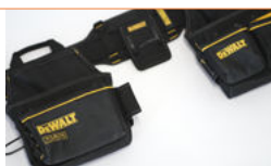
Gordel werk materiaal