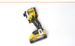
Gewone schroefmachine of slagboormachine