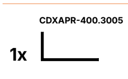
L-profiel, lengte 3500 mm