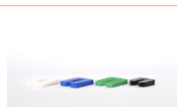
Kunststof afstelblokken van verschillende diktes

! VOLG STEEDS DE RICHTLIJNEN EN PROCEDURES VAN DE PRODUCENT OF LEVERANCIER. ZORG STEEDS VOOR EEN VEILIGE WERKOMGEVING EN GEBUIK PERSOONLIJKE BESCHERMINGSMIDDELEN.