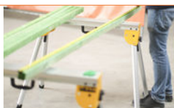
Schragen of werkbank (voor materiaal) + accessoires